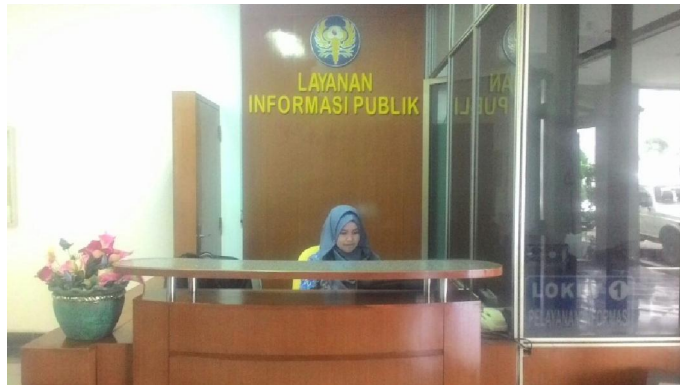
Gambar 1 Desk pelayanan informasi publik

PPID Politeknik STTT Bandung memiliki ruangan khusus untuk pelayanan informasi publik yang cukup baik untuk memberikan pelayanan informasi yang nyaman dan aman.