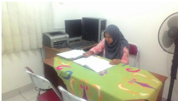
Gambar 2 Ruang pelayanan dan petugas informasi publik